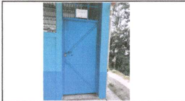
Foto 1: Mantenimiento a estructura (lijado, cambio de tubo, cepillado, sujeciones, aplicación de pintura)